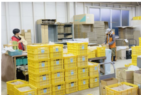
▲動線改善をした作業場