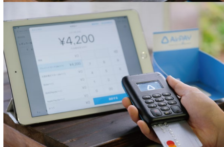
▲シンプル、カンタンで誰にでも使える Airレジ(上)とAirペイ(下)