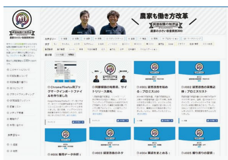
▲「阿部梨園の知恵袋」TOPページ