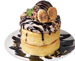
濃厚チョコホットケーキ 980円