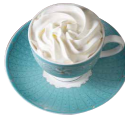
ウィンナーコーヒー 650円

オプションで生クリームホイップやアイスクリームがトッピングできる定番メニュー「手作りホットケーキ」には「濃厚チョコホットケーキ」ほかティラミスや和風、季節限定などのバリエーションがあり、華やかなパフェと共に味とボリュームで人気商品となっている。もちもち食感の生パスタ4種類ほかホットサンドなど軽食メニューも充実。