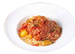
トマトソース生パスタ 930円